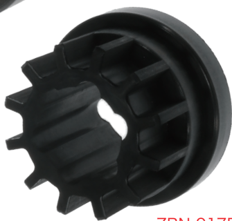
ZRN-917RB (交換用ゴム) ZR-966 への後付け部品としても使用可