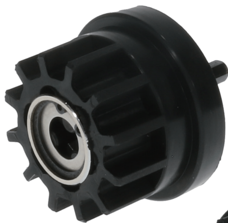
ZRN-917 ズンギリソケット ZR-966 + ZRN-917RB