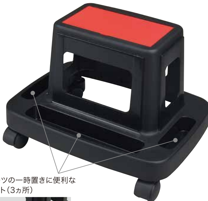
工具やパーツの一時置きに便利な 収納ポケット(3カ所)