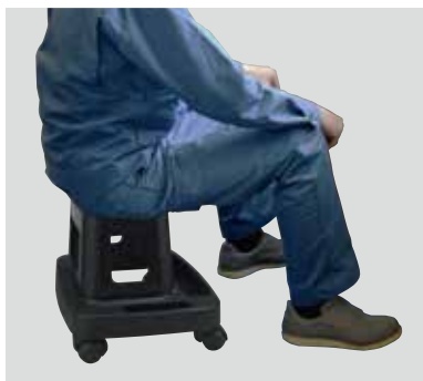
座りながら作業ラクラク