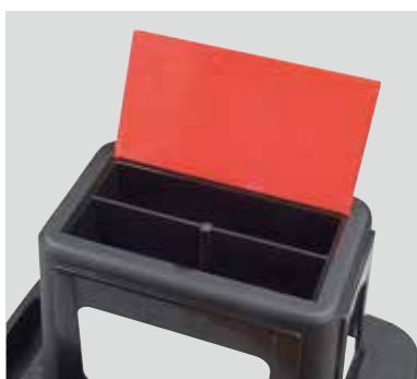
座面下の収納スペース