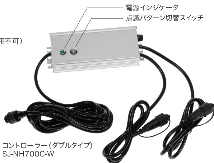
コントローラー (ダブルタイプ) SJ-NH700C-W