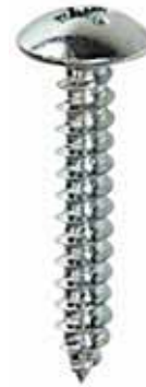
4 x 2.5mm