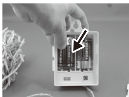
②単1アルカリ電池を入れる。