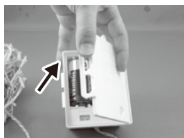
①フタのつまみを、引っ掛けて開ける。