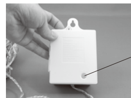
④ボタンを押して点灯確認。