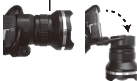
可動式ヘッド 90°回転時