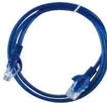
●RJ45パッチコード (長さ:約850mm)