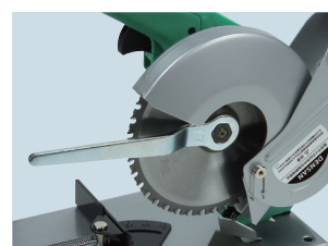
チップソーの交換が簡単な ウルトラクイックフランジ採用