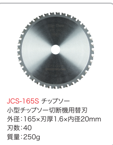
JCS-165S チップソー 小型チップソー切断機用替刃 外径：165×刃厚1.6×内径20mm 刃数：40 質量：250g

電圧：単相100V 定格電流：4.5A 消費電力：435W サイズ：165×325×430mm 質量：4.3kg 刃物径：165mm 回転数：8500min -1