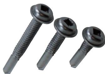
厚鋼板用ネジ・ステンレス