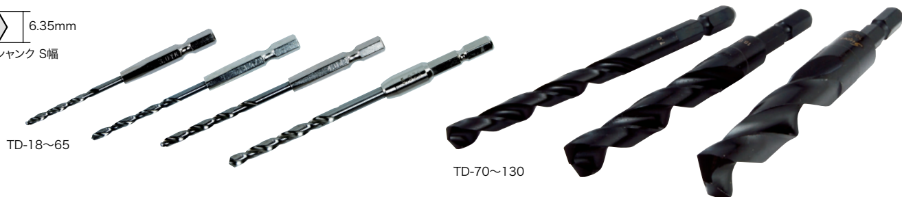
六角軸鉄工ドリル単品