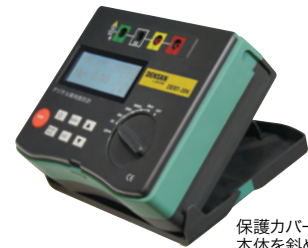
保護カバーをスライドして本体を斜め置きできます