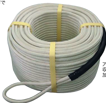
アイ部分 収縮チューブ 加工済