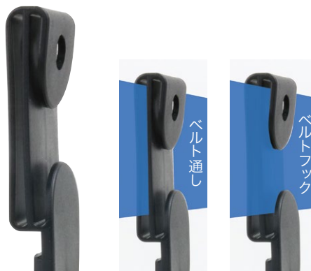
ホルダーには、幅広ベルト(65mmまで)対応の ベルト通し&ベルトフック付