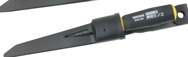
使用時(ノコは商品に含まれません)