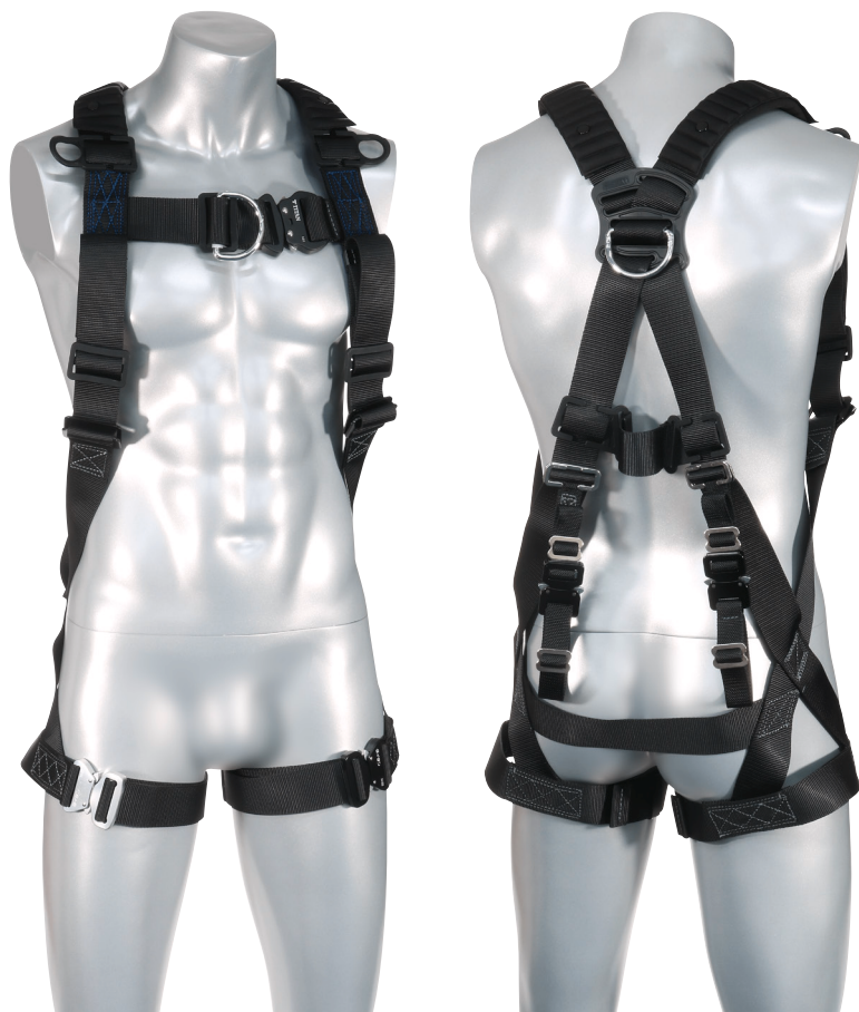
ハーネスサイズの目安