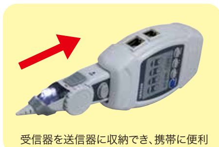
配線探査イメージ図