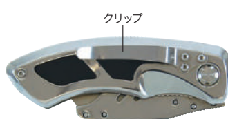
折りたたみ時(裏側)