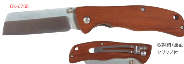
収納時(裏面) クリップ付