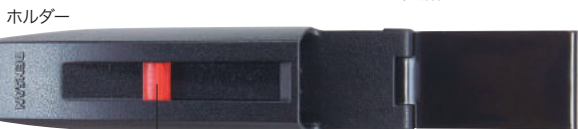
スライドロック機構でナイフを確実にロック