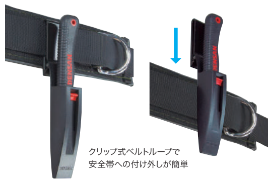
クリップ式ベルトループで 安全帯への付け外しが簡単