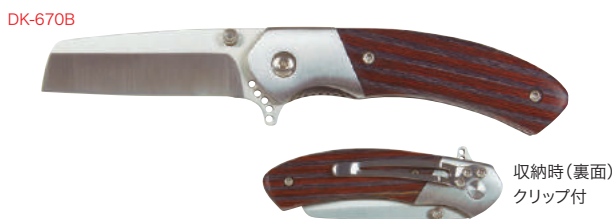
収納時(裏面) クリップ付