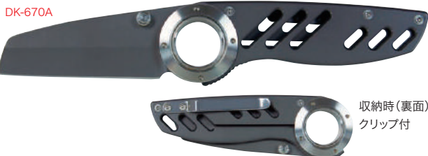
収納時(裏面) クリップ付