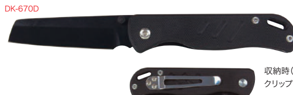
収納時(裏面) クリップ付