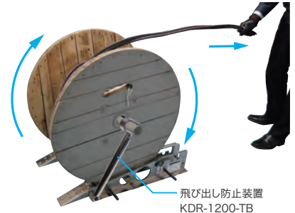
飛び出し防止装置 KDR-1200-TB