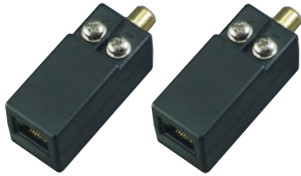
RCAタイプ LCB-100R (2個セット)