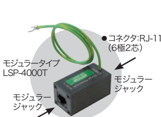
モジュラータイプ LSP-4000T