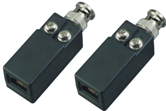
BNCタイプ LCB-100B (2個セット)