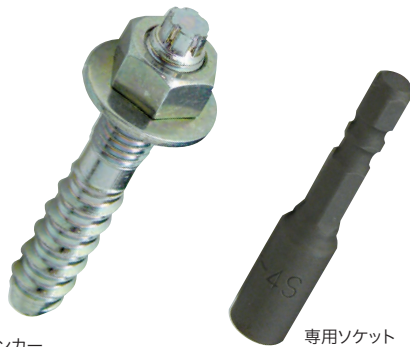
ノープラグアンカー ※締結には専用ソケット が必要です。