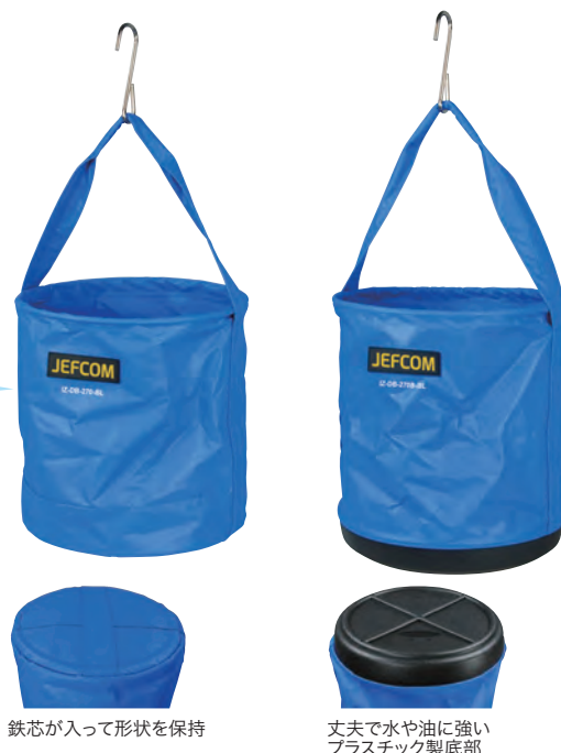
鉄芯が入って形状を保持