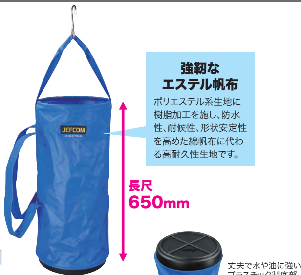
丈夫で水や油に強いプラスチック製底部