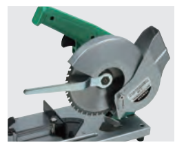
チップソーの交換が簡単な ウルトラクイックフランジ採用