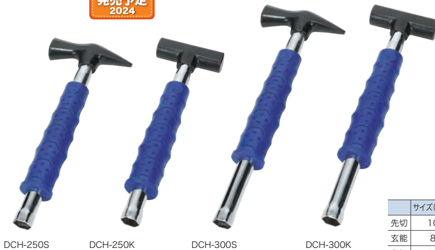
DCH-250S DCH-250K DCH-300S DCH-300K