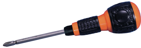
両頭ビット ⊕ ⊖ #2x6.0x135