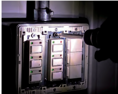
3つのLEDライトでビットの影ができない