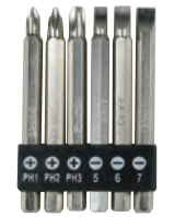
専用ビット(75mm x 6)