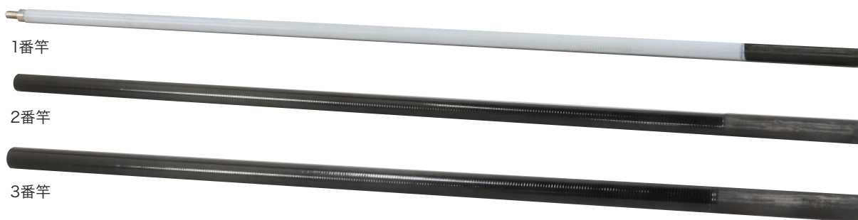
シルバーフィッシャー(プラス) 交換用先端竿